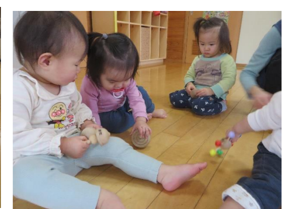
こま回るかな？みんなで挑戦!