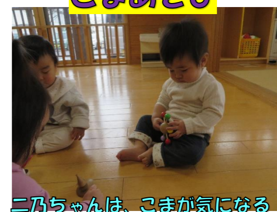
二乃ちゃんは、こまが気になる様子。触って確かめています。