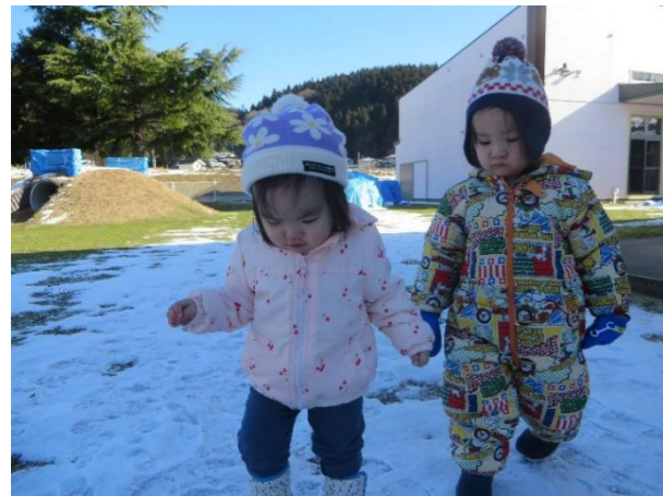
歩くたびに、なんだか音がする・・・