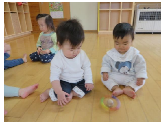
くるくる回ってきれいだね!