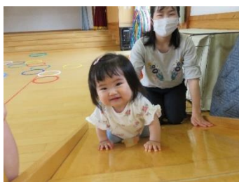
滑り台たのしいね~!!