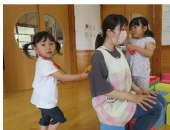
お医者さんに変身! 聴診器で「もしもし」しているよ!

今月は、手作りおやつ（黒糖ラスク）の試食がありました。「おいしい!」と大好評でした♪