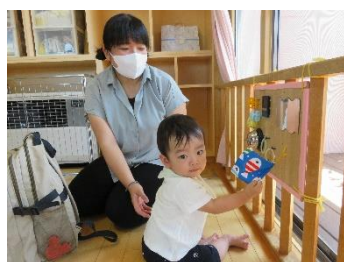
楽しい玩具がいっぱい!!