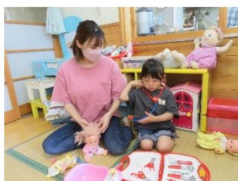
お医者さんごっこに夢中♡