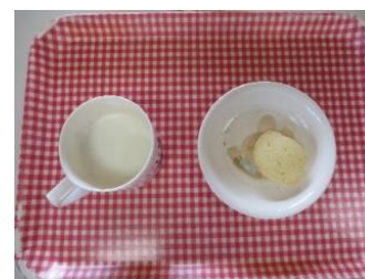
米粉のチーズクッキー