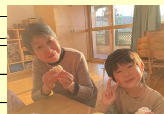
きりんさんが 収穫したお米で おにぎり作り