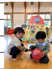
お友達と ボール遊び