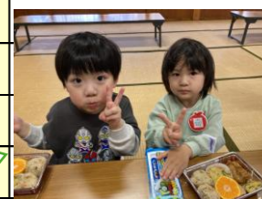
給食の先生が 作ってくれた 出前弁当